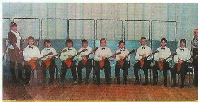
Ансамбль «Русский сувенир» Россия, Рязанская область г. Рязань МБОУ ДОД ДШИ №4 им. Е.Г. Попов Руководитель: Кучумова С. Концертмейстер: Колданова Н. Конкурсная программа В. Андреев Вальс «Искорки» переложение Г. Андрюшенков Русский народный танцевальный наигрыш «Па д, эспань» Обработка Н. Грязнов Р.н.п «Степь, да степь кругом» Обработка А. Шалон Д. Эллингтон «Караван»